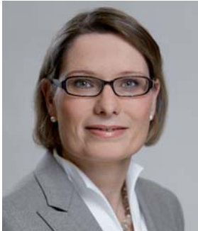
д-р Штефани Хубиг Министр образования